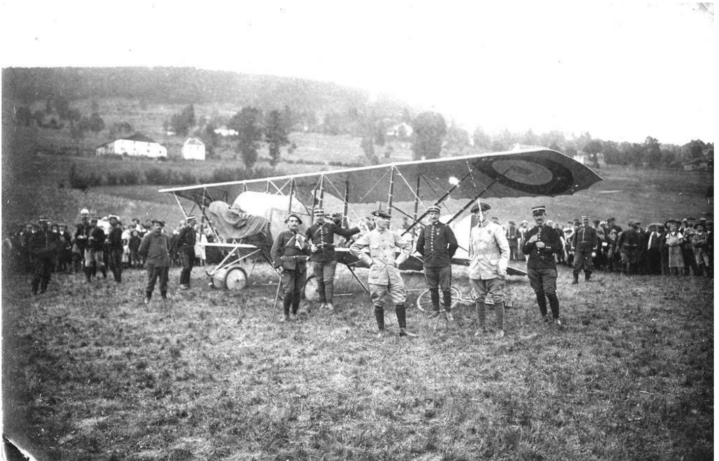
Les 3 photos précédentes transmises par Hervé Legendre petit fils de Marcel